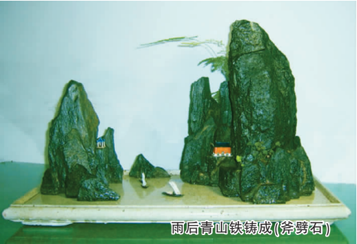
雨后青冈铁铸成(斧劈石)