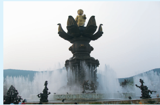
九龙灌洛莲花铜雕